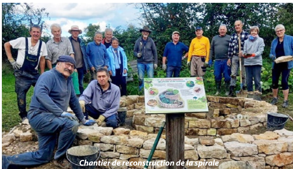
Chantier de reconstruction de la spirale