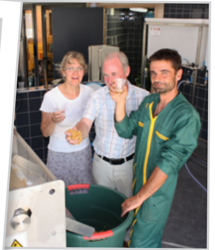
1ère pressée septembre 2010