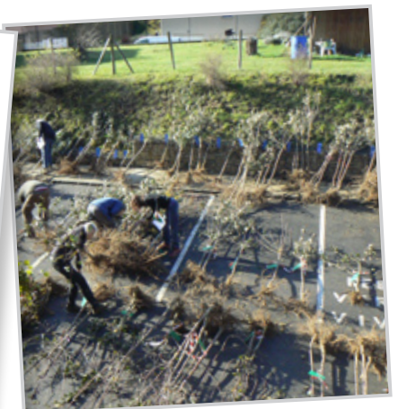
Les commandes d'arbres : 6314 arbres plantés depuis 2009