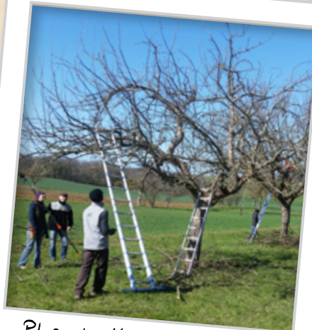
Plus de 160 formations dispensées depuis 2008