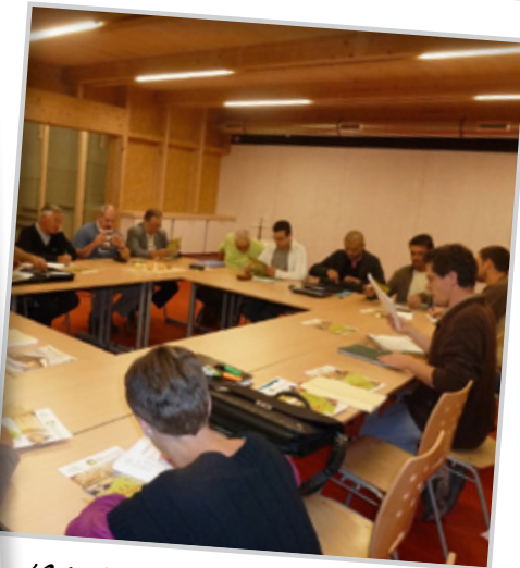
1er CA à la Damassine le 1er septembre 2010