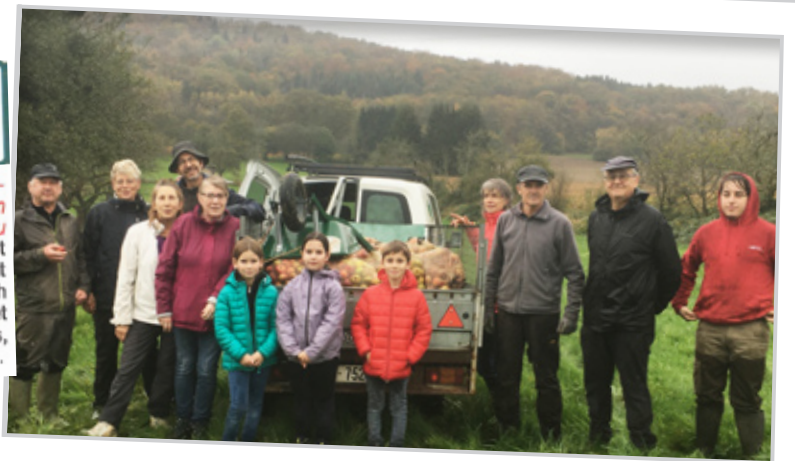
190 tonnes de pommes récoltées depuis 2007