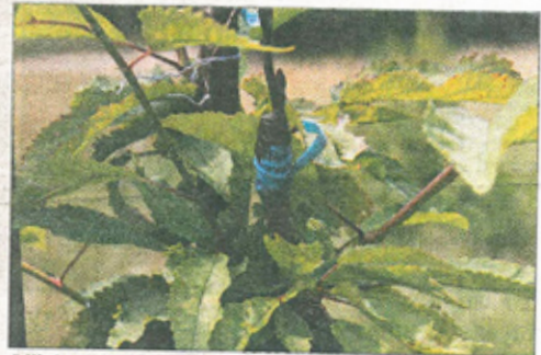
Déjà des élèves ont appris à greffer des arbres au verger-école.

Montbouton, les parents d'élèves, les associations des Croqueurs de pomme et Vergers vivants ont participé à ce projet. D'autres projets autour des fruitiers sont portés par la communauté d'agglomération du pays de Montbéliard comme la vente aux particuliers d'arbres à haute tige à prix attractifs, la mise en place d'une équipe spécialisée dans la taille, la greffe, la plantation qui pourra conseiller les particuliers et bien-sûr les informer grâce à la future Maison des vergers (voir encadré).