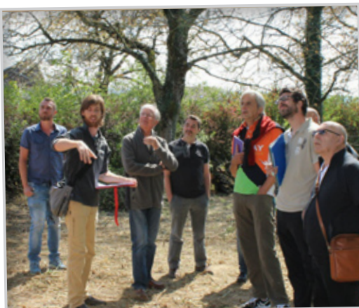
Acquisition du verger pédagogique 1ère réunion - Avril 2017

La communauté d'agglomération du pays de Montbéliard a lancé la construction d'une Maison des vergers à Vandoncourt. Elle aura pour objectif de faire découvrir et apprécier le patrimoine d'arbres fruitiers local afin de le préserver. La Maison des vergers accueillera donc, sur 850 mètres carrés, des salles d'exposition et de réunion pour les associations, mais aussi un pressoir et une miellerie. Une boutique vendra les produits issus de la culture fruitière : confitures, jus de fruits... ainsi que des supports de sensibilisation. Inauguré voilà un an, le verger-école de 3 000 m 2 avoisinant permet déjà des actions pédagogiques ainsi qu'une conservation des espèces. La Maison des vergers sera également un modèle en matière d'énergie de part sa conception bio-climatique, ses panneaux photovoltaïques, sa chaudière au bois déchiqueté, ses murs en paille, son triple vitrage. L'ouverture est prévue fin 2009.