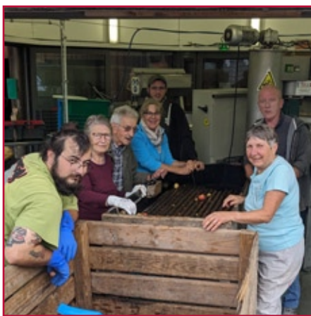
Merci aux bénévoles présents !

Répartition communale 2010-2020 ■ Présence ■ Prospection nulle ■ Commune non prospectée