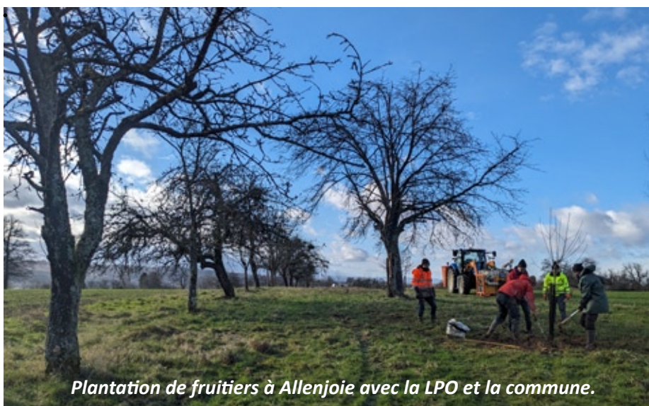
Plantation de fruitiers à Allenjoie avec la LPO et la commune.

Pour ce projet, la Ligue de la Protection des Oiseaux Bourgogne-Franche-Comté et Vergers Vivants se sont donc associées en raison de la similitude des objectifs suivis pour la sauvegarde du patrimoine verger haute tige, dont la Chevêche d'Athéna est l'espèce emblématique.