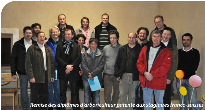
Remise des diplômes d'arboriculteur patenté aux stagiaires franco-suisses

Depuis 2010, et jusqu'à la fin de l'année, Pays de Montbéliard Agglomération a confié la mise en oeuvre de ce projet à Vergers Vivants.