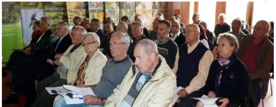
Assemblée générale : une assemblée attentive !

La création de Vergers Vivants en 2006 puis de la Damassine en 2010 démontrent qu'ils satisfont les attentes des propriétaires de vergers en matière de