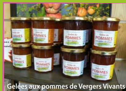
Gelées aux pommes de Vergers Vivants

Nos producteurs locaux ont préparé leurs recettes de printemps : Sirop de primevères, confiture cramailotte, gelée de bourgeons de sapin, pesto d'ail des ours, mélanges fleuris pour infusions... Et Vergers Vivants a concocté de délicieuses gelées aux pommes.