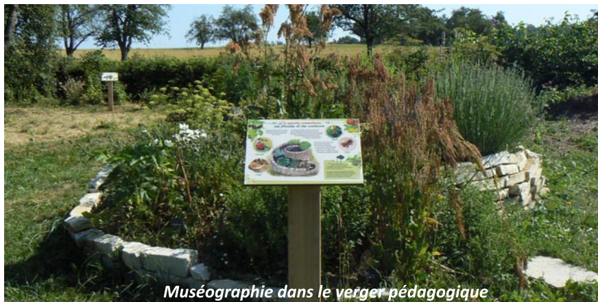
Muséographie dans le verger pédagogique

Merci aux bénévoles qui rendent possible cette opération qui nécessite rigueur et énergie !