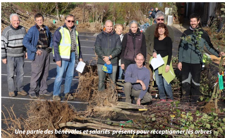
Une partie des bénévoles et salariés présents pour réceptionner les arbres

L'inventaire réalisé sur le territoire des 29 communes de la communauté d'agglomération du Pays de Montbéliard, avant son extension à 72 membres, fait apparaître l'urgence de rajeunir la population de fruitiers. Deux tiers des 36 000 arbres inventoriés en zone agricole sont considérés comme « productifs anciens » ou « sénescents ». La plantation d'arbres, de préférence de variétés anciennes, est donc une priorité pour notre association.