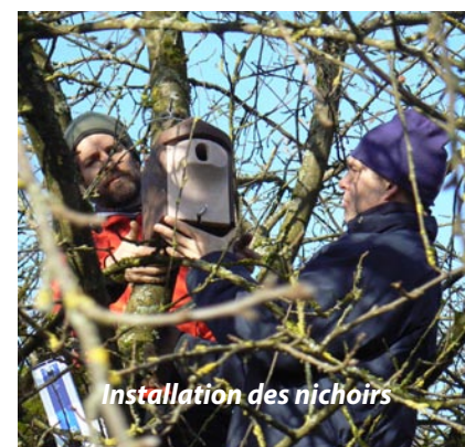
Installation des nichoirs

De nombreux nichoirs ont été installés dans le verger permettant l'hibernation ou le refuge de chauves-souris, la nidification de la chouette chevêche, de passereaux, le refuge de muscardins, forficules, bourdons, etc.