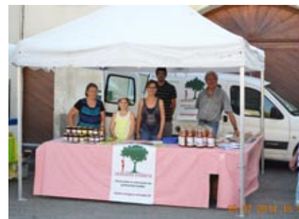
Le stand de l'association à Taillecourt en 2014

Retrouvez Vergers Vivants sur ces marchés organisés par PMA en partenariat avec la Chambre d'Agriculture du Doubs et du Territoire de Belfort.