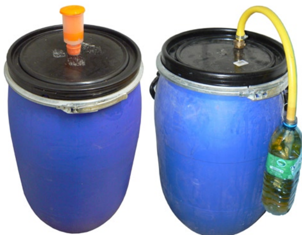
Bonde de fermentation

Il est important de stocker vos récipients dans un local chauffé à une température dans l'idéal de 18-20°C. Il peut être utile d'isoler le récipient du sol à l'aide d'une palette