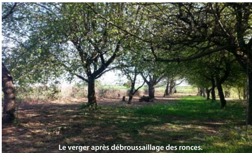
Le verger après débroussaillage des ronces.

► Une haie champêtre : elle permet d'abriter ou de nourrir un grand nom-