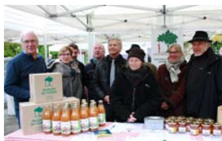
Bonne ambiance au marché d'Hérimoncourt 2017

Retrouvez Vergers Vivants sur ces marchés organisés par PMA en partenariat avec la Chambre d'Agriculture du Doubs et du Territoire de Belfort.